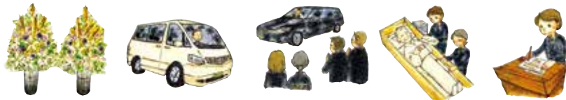
お供え生花(1対) お迎え寝台車(~10km) 出棺寝台車(~10km) ご納棺 手続・手配