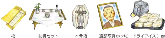
棺 枕机セット 本骨箱 遺影写真(六ツ切) ドライアイス(1回)