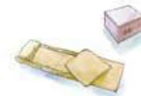
ご遺体用 布団・保護シート