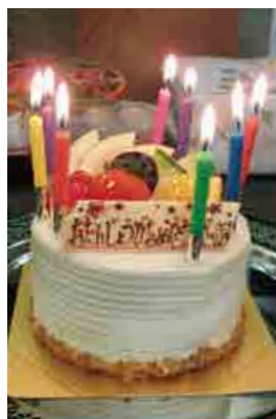
お通夜の日がちょうどお母様の誕生日と知ったスタッフが用意したサプライズの誕生日ケーキ。孫4人が母に代わって食べました。きめ細やかな気配りに感謝しています。

参列者の中には遠方から来られた方もいたそうですが、「その点こは、地下鉄の平野駅からすぐで交通の便もよいですし、式場内はリビングやダイニングキッチン、和室にバスルームまで完備していて、まるで自宅にいるよう。通夜の日も式場の2階と1階に12人ほど泊まりましたが、お部屋もきれいで親戚にも好評でした」