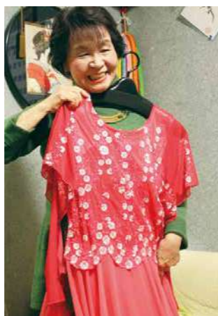
「棺の中にこのドレスを入れてもらい、葬儀中はひばり座に就いた際制作したひばりさんと私が交代で歌っているCDをかけてもらおう!とお願ひしています!」

数ある葬儀社の中からファミリリー葬を選んだのは、「見学に行った時の印象がとても良くて。これまでたくさん葬儀に参列して、いろいろな葬儀社を見てきましたが、ファミリリー葬はサービスが行き届いていますし、スタッフの皆さんがよい方ばかり。葬儀で流してほしい歌や棺に入れてほしいドレスもすでに伝えていて、『ここなら任せて安心!』と信頼を寄せています。お友だちにも、そう言ってもらっていますよ!」