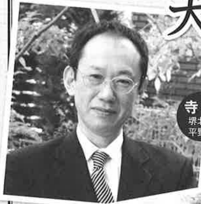
寺岸 堺北店 平野店